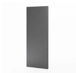
Panneau plein Achat/location