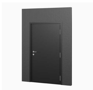
Panneau de porte 115 x 210 cm Achat/location