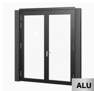
Vitrage avec porte à double battant 207 x 262 cm Achat