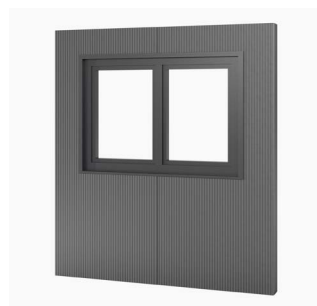
Panneau double fenêtre 2 battants, 175 x 120 cm Achat/location