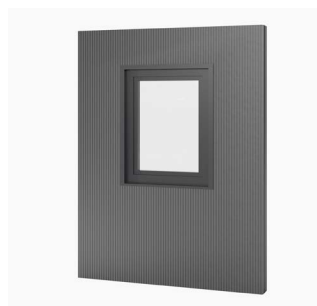
Panneau de fenêtre 1 battant, 95 x 120 cm Achat/location