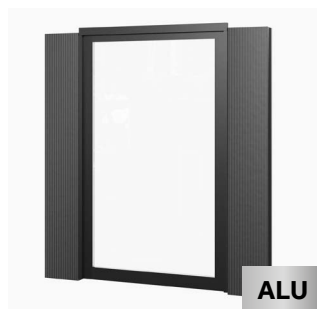
Vitrage intégral (170 cm) 170 x 262 cm Achat