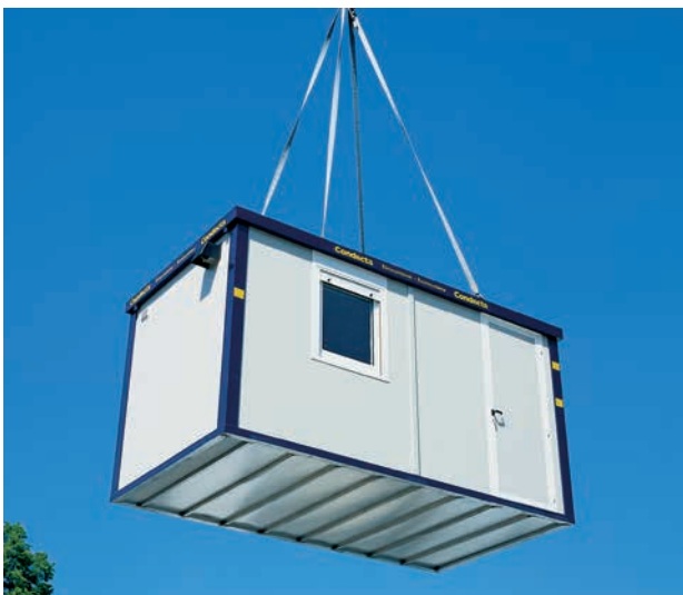
4 anneaux de levage renforcés permettent de gruter le container en toute sécurité