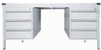
TABLE DE BUREAU «ECONOMY»

Système de table flexible, réglable en hauteur, au design classique et pied joliment galbé en C. Piétement en tube d'acier rond, RAL 9006 aluminium blanc, revêtu par poudre. Hauteur de travail 650 – 850 mm. Réglable en hauteur par pas de 1 cm. Avec passage de câbles horizontal. Plateau RAL 7035 gris lumière. 25 mm d'épaisseur.