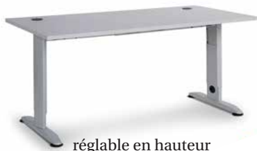
réglable en hauteur