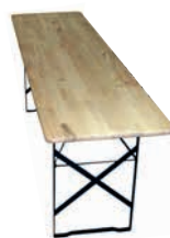
TABLE POUR ENSEMBLE DE BANCS «ECONOMY»

Banc individuel pour ensemble de bancs en bois suisse, fabriqué par une institution sociale. Surface du bois poncée et vernie avec une couche de fond et une couche de finition sans solvant, incolore. Structure en métal revêtu par poudre, anthracite.