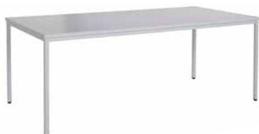
TABLE DE RÉUNION «XL» «ECONOMY»

Table de réunion S Economy pliable, piétement gris clair, plateau gris.