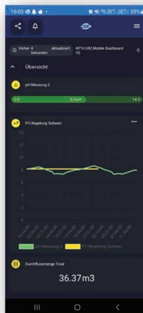
Neue App- und Cloud-Funktionen