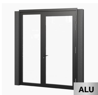
Verglasung mit Tür 207 x 262 cm Kauf