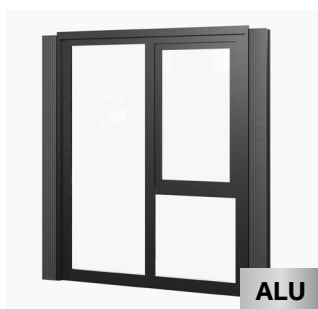
Verglasung mit Dreh-/Kippenelement 207 x 262 cm Kauf