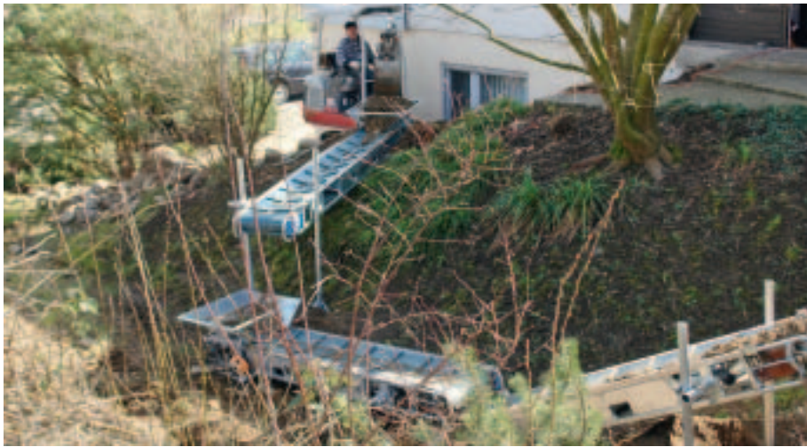
Es können bis zu drei Bänder elektrisch verbunden werden.