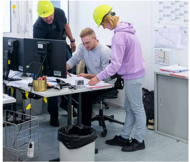
Möblierung nach Ihren Wünschen